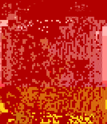
北京大學教育學院成立十周年紀念

北京大學教育學院成立十周年紀念。教育學院是北大的重要組成部分，是北大人文社會科學研究的重要基地。學院成立以來，在教學、科研、社會服務等方面取得了長足的進步。