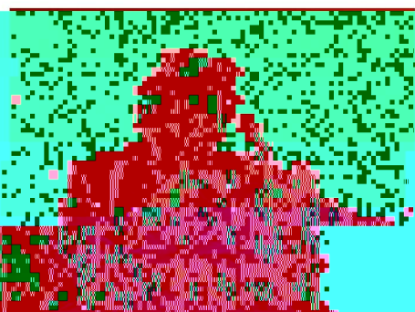
香港教育學院的戶外編織與染織

《上校策·版》的執照，均應由：教育研究圖書館及教育研究中心負責發行。 “教育研究圖書館及教育研究中心地址：香港九龍彌敦道348號香港教育學院圖書館。